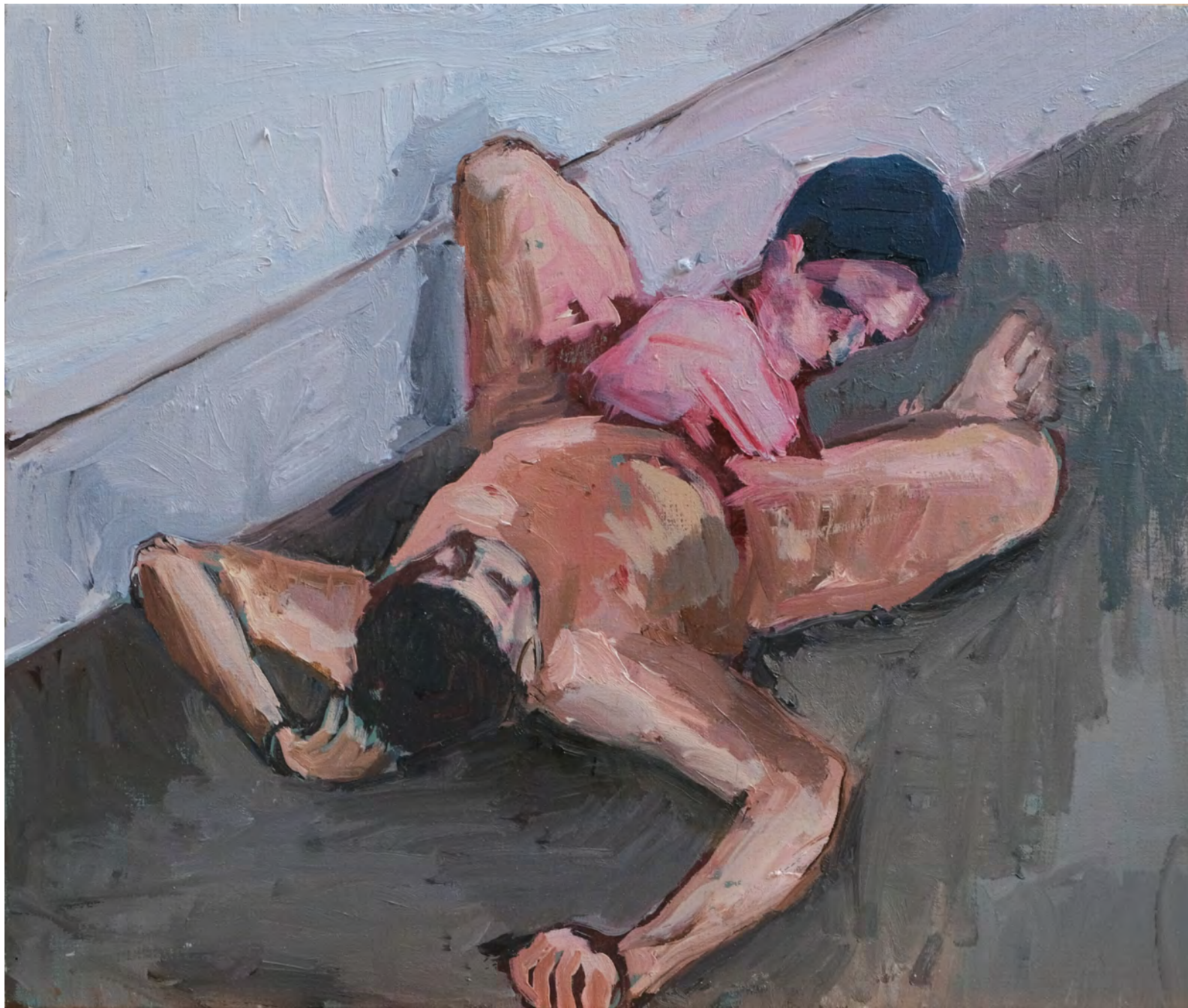
Sem Título [Untitled] , 2019 . óleo sobre tela [oil on canvas] . Ed. única [unique] . 37 x 44 cm