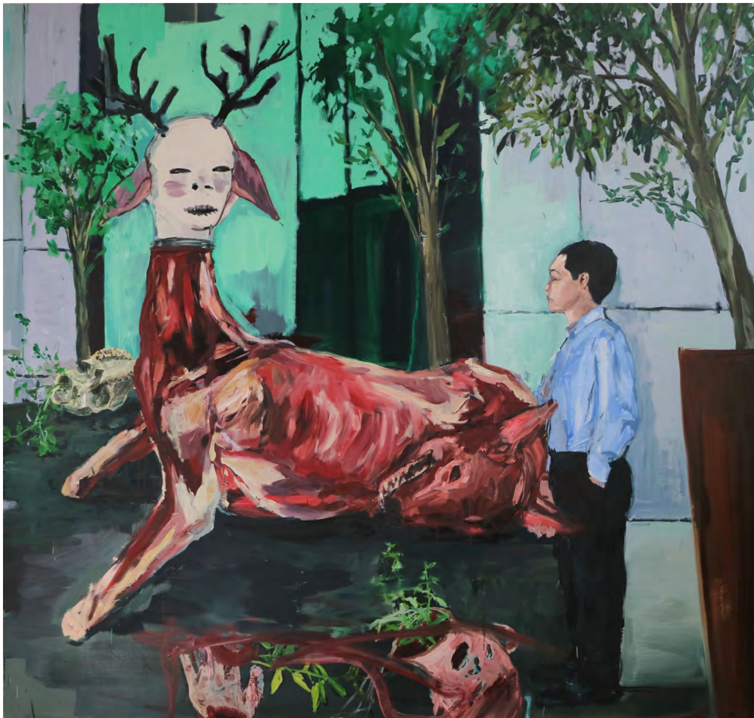
Acteon , 2018 óleo sobre tela [oil on canvas] Ed. única [unique] . 220 x 220 cm