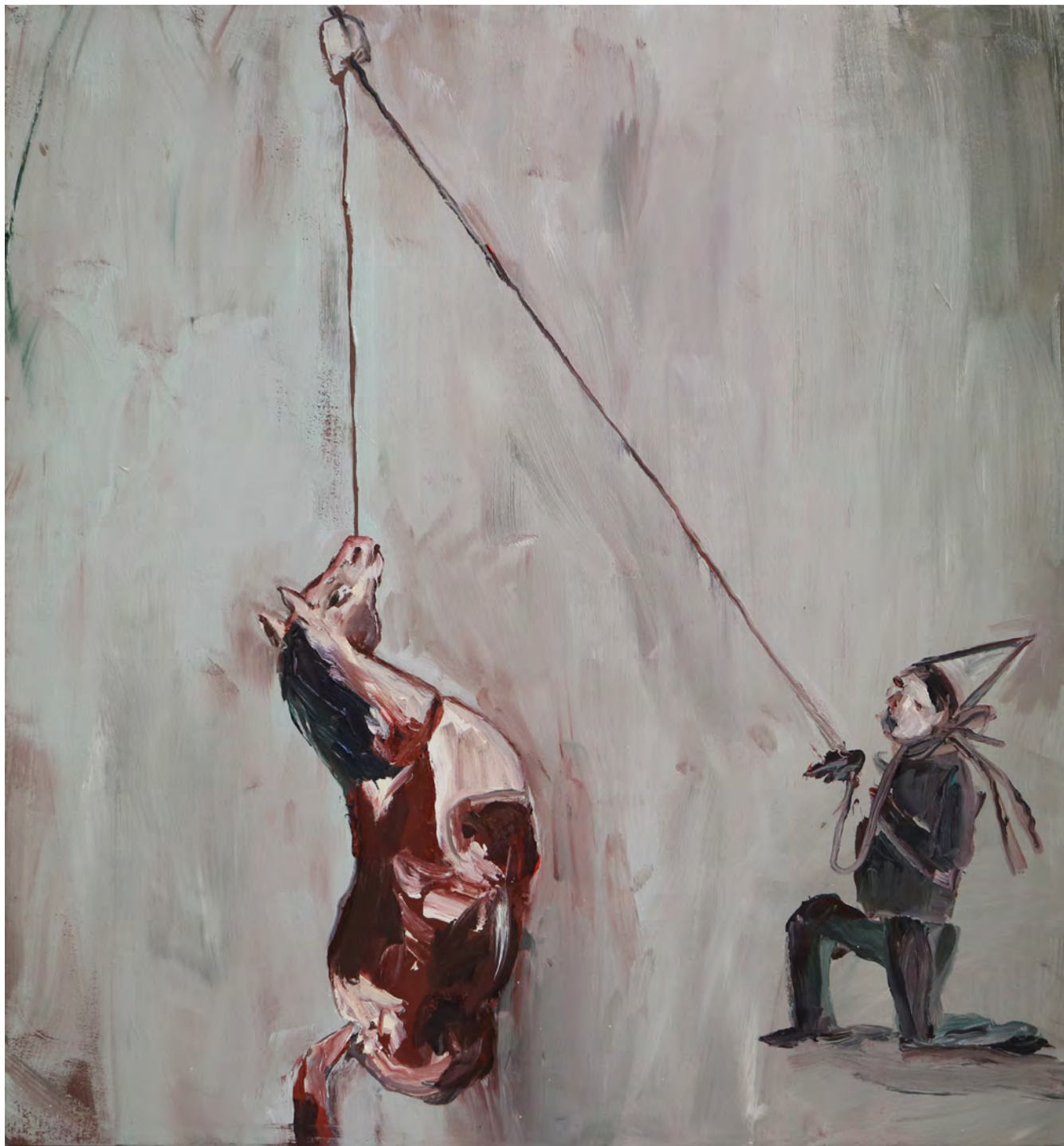
Pendurado , 2017 óleo sobre tela [oil on canvas] Ed. única [unique] . 80 x 70 cm