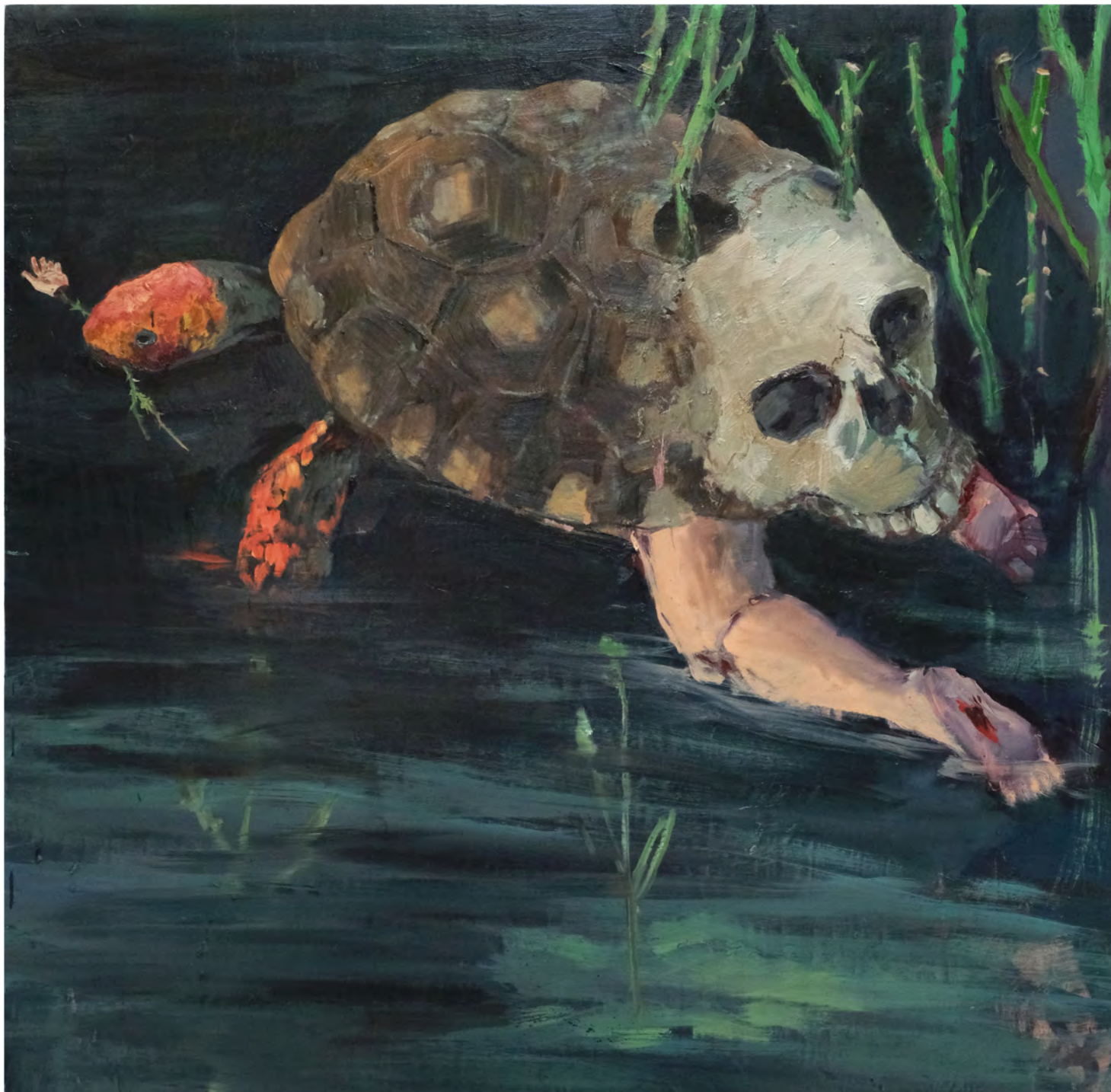
Tartaruga , 2019 óleo sobre madeira revestida com fórmica [oil on wood coated with formica] Ed. única [unique] . 105 x 100 cm