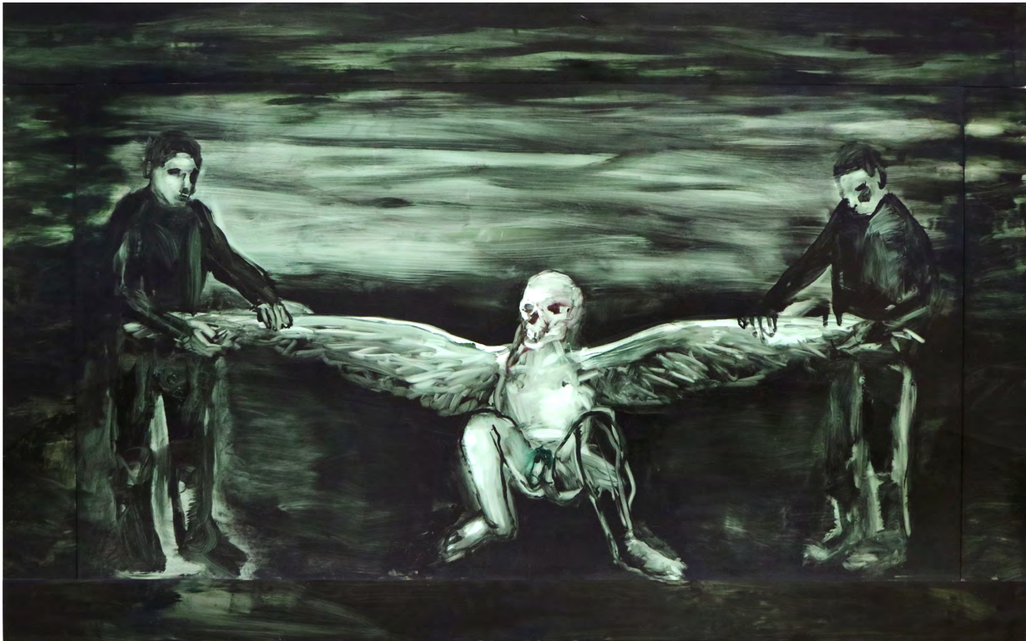
A Captura , 2018 . óleo sobre fórmica [oil on formica] . Ed. única [unique] . 155 x 250 cm