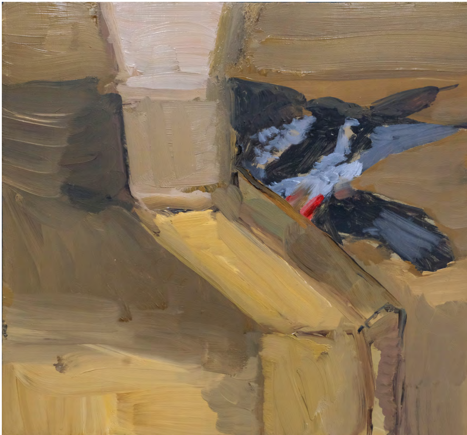
Pombos 1 , 2019 óleo sobre madeira [oil on wood] Ed. única [unique] . 22 x 22 cm