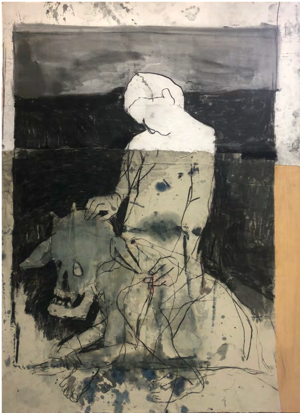
Azulão , 2019 carvão e grafite sobre lona montado sobre madeira [charcoal and graphite on canvas assembled on wood] Ed. única [unique] . 240 x 160 cm