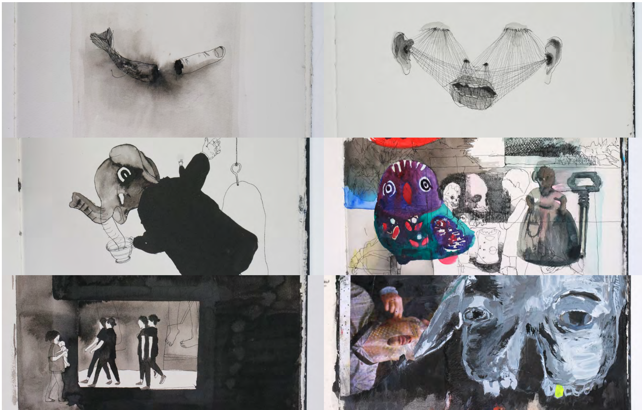
detalhes Sem Título [Untitled] , 2018-2019 . mesa com 10 cadernos, cavalete e tampo de vidro [table with 10 notebooks, easel and glass cover] . Ed. única [unique] . 187 x 147 cm