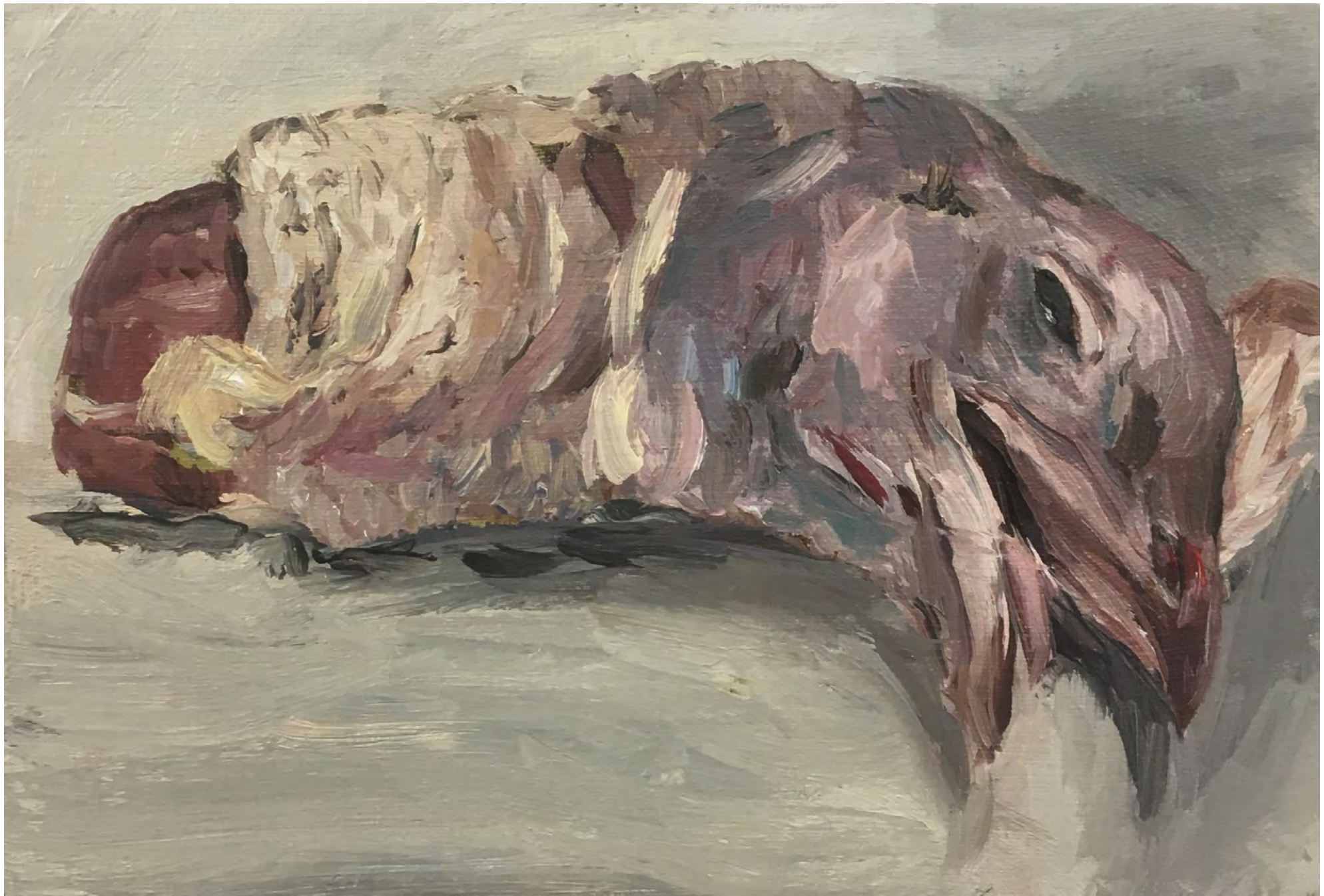
Pescoço , 2019 . óleo sobre tela [oil on canvas] . Ed. única [unique] . 11 x 16 cm