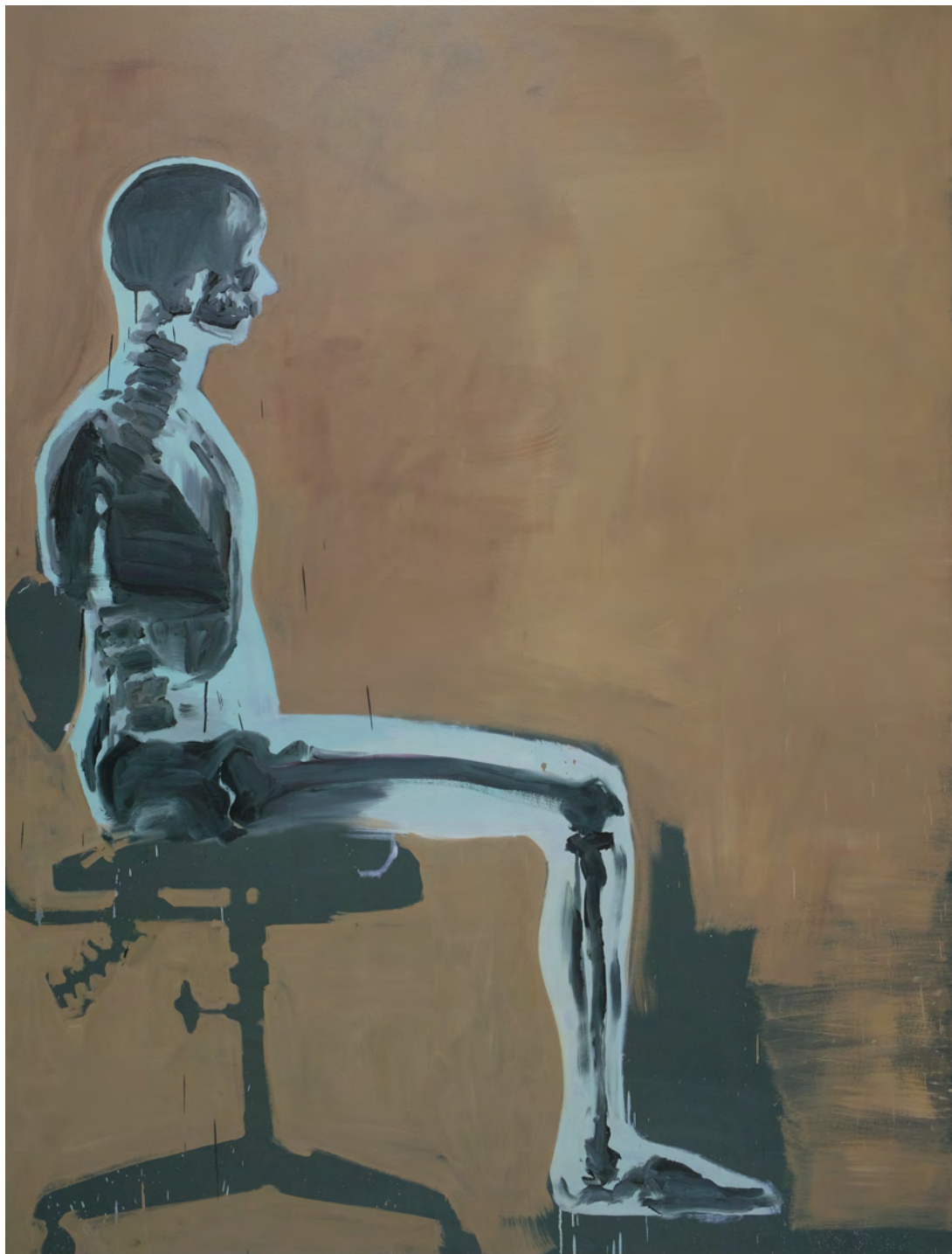
Esperando , 2019 óleo sobre tela [oil on canvas] Ed. única [unique] . 240 x 170 cm