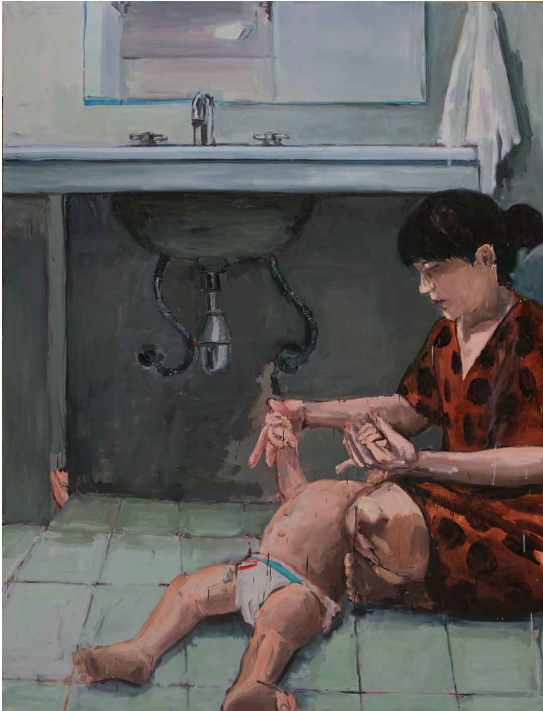
Pia , 2019 óleo sobre tela [oil on canvas] Ed. única [unique] . 220 x 160 cm