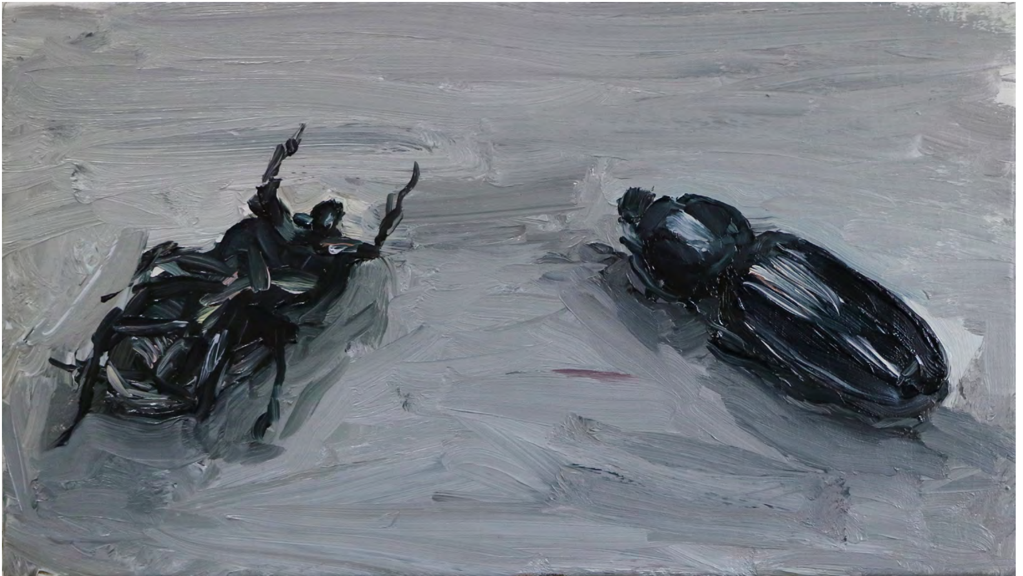
Besouro , 2018 . óleo sobre tela [oil on canvas] . Ed. única [unique] . 17 x 30 cm