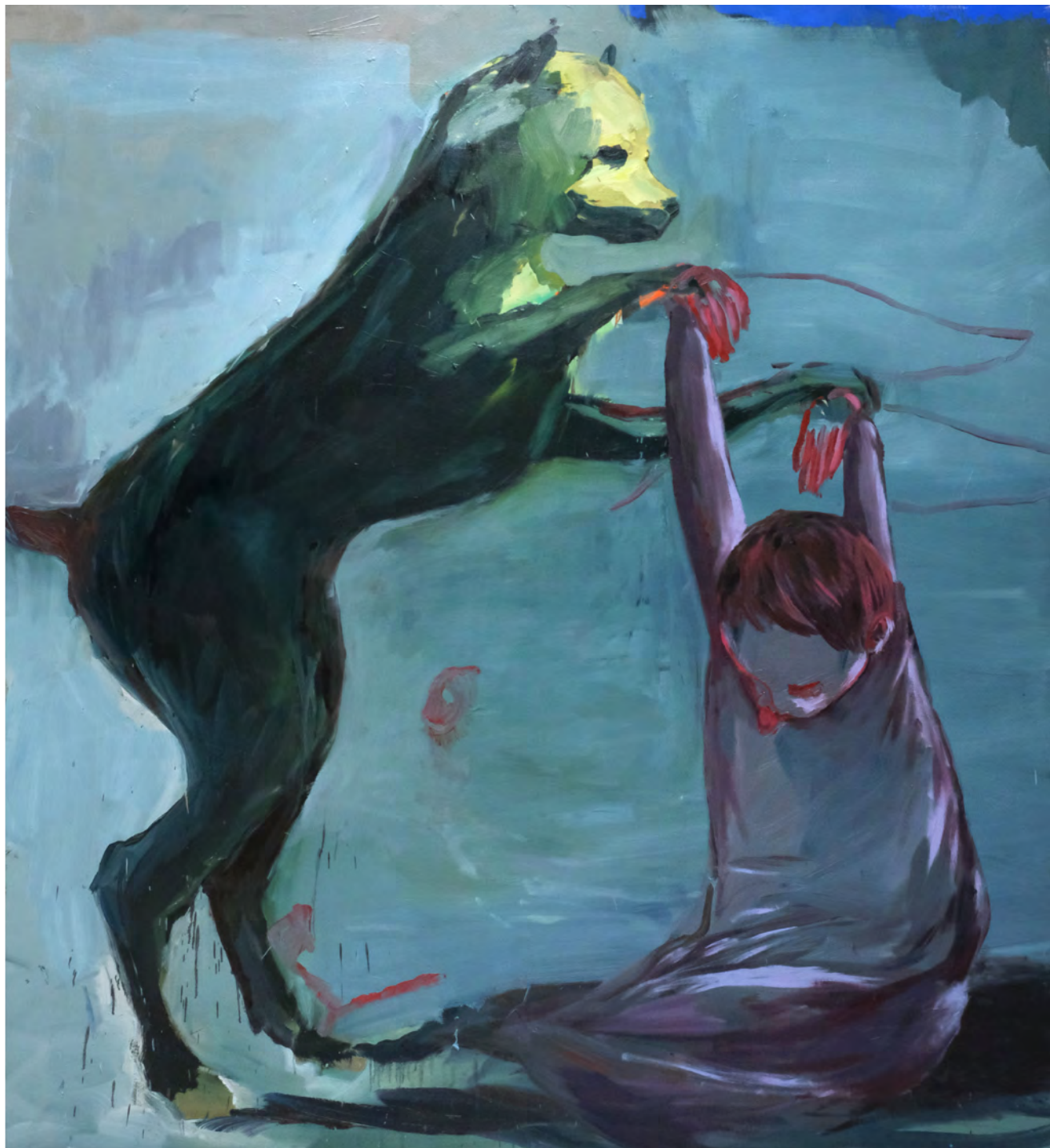
Cão , 2019 óleo sobre tela [oil on canvas] Ed. única [unique] . 220 x 190 cm