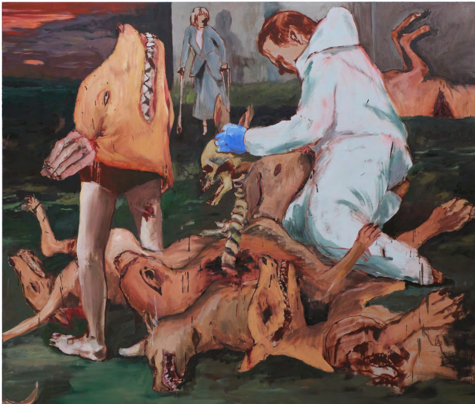
Ossada , 2019 . óleo sobre tela [oil on canvas] . Ed. única [unique] . 135 x 160 cm