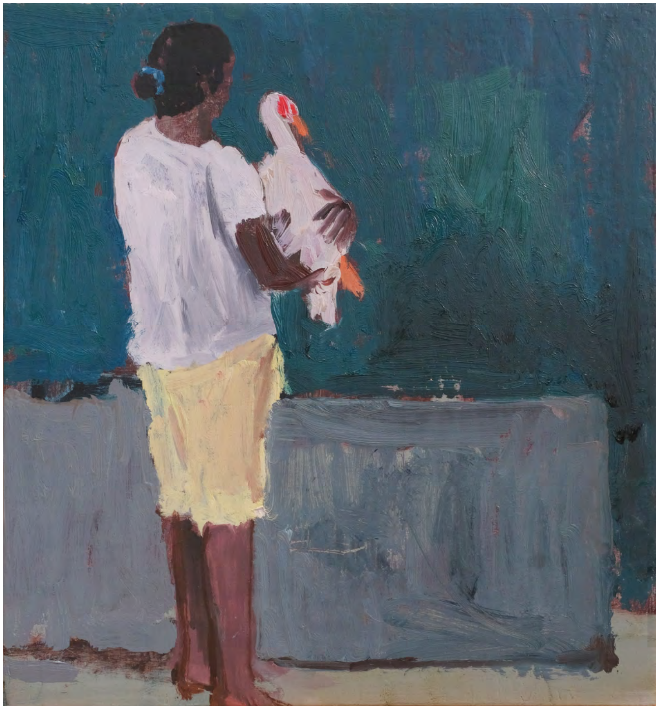
Lúcia e o pato , 2019 óleo sobre madeira [oil on wood] Ed. única [unique] . 40 x 35 cm