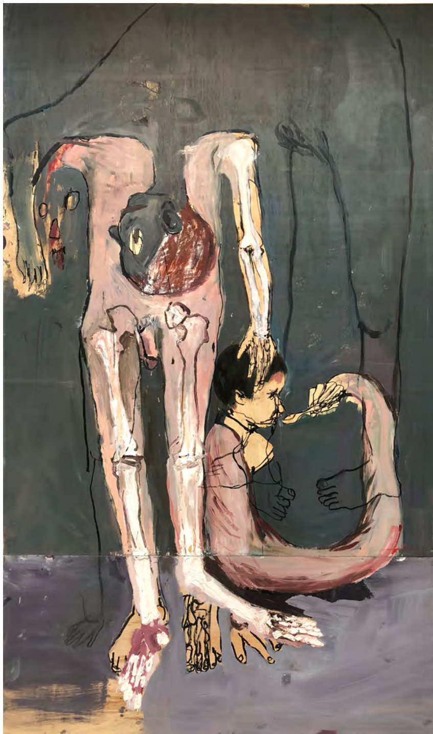
Colherinha , 2018 óleo sobre madeira [oil on wood] Ed. única [unique] . 290 x 160 cm