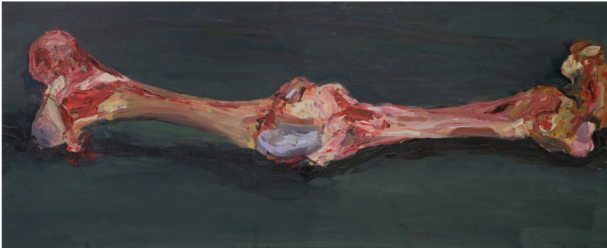
Osso , 2019 . óleo sobre madeira [oil on wood] . Ed. única [unique] . 70 x 170 cm