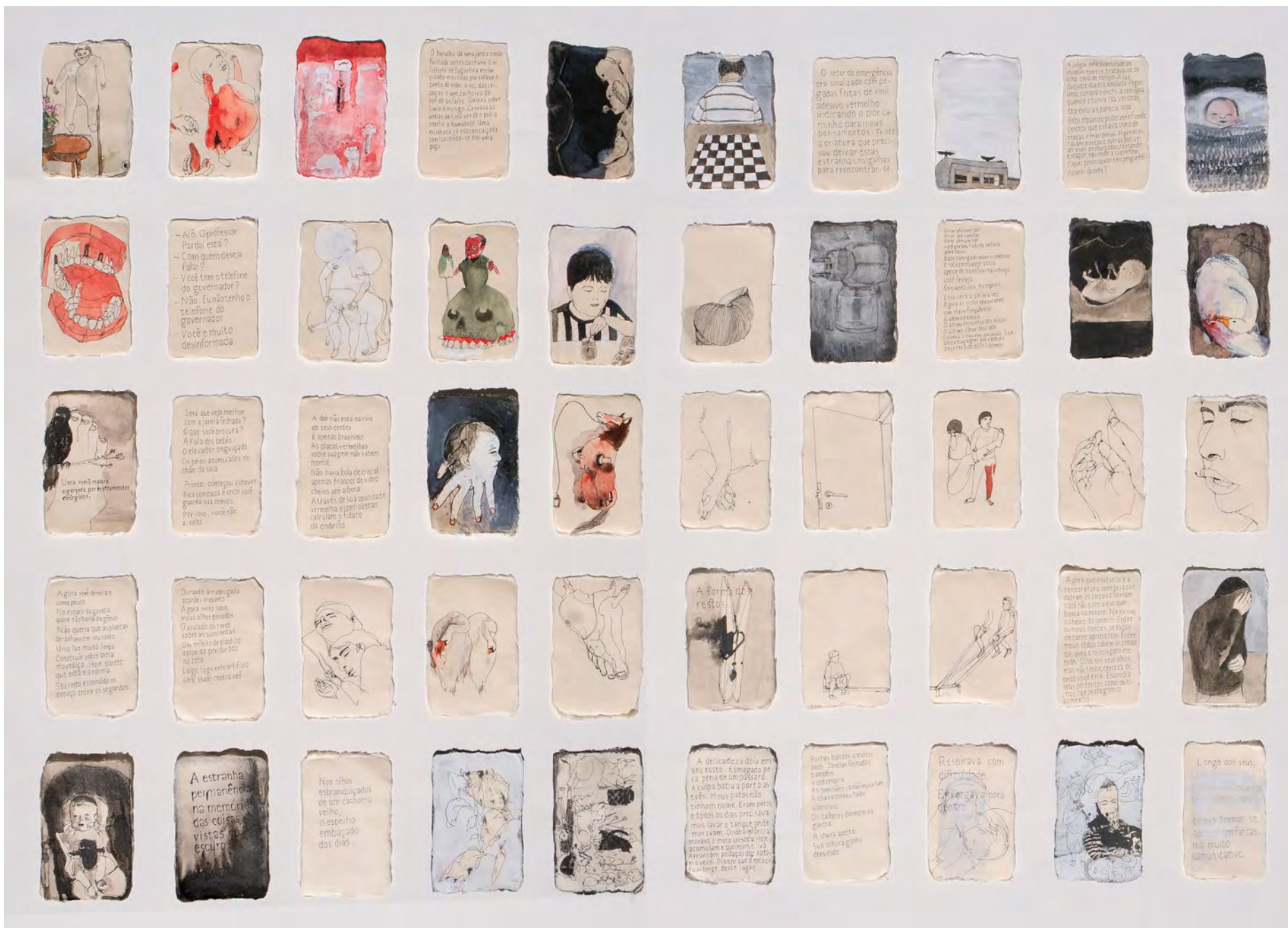
Sem Título [Untitled], 2017-2018 . mesa com 50 cartões, cavalete e tampo de vidro [table with 50 cards, easel and glass cover] . Ed. única [unique] . 119 x 85 cm