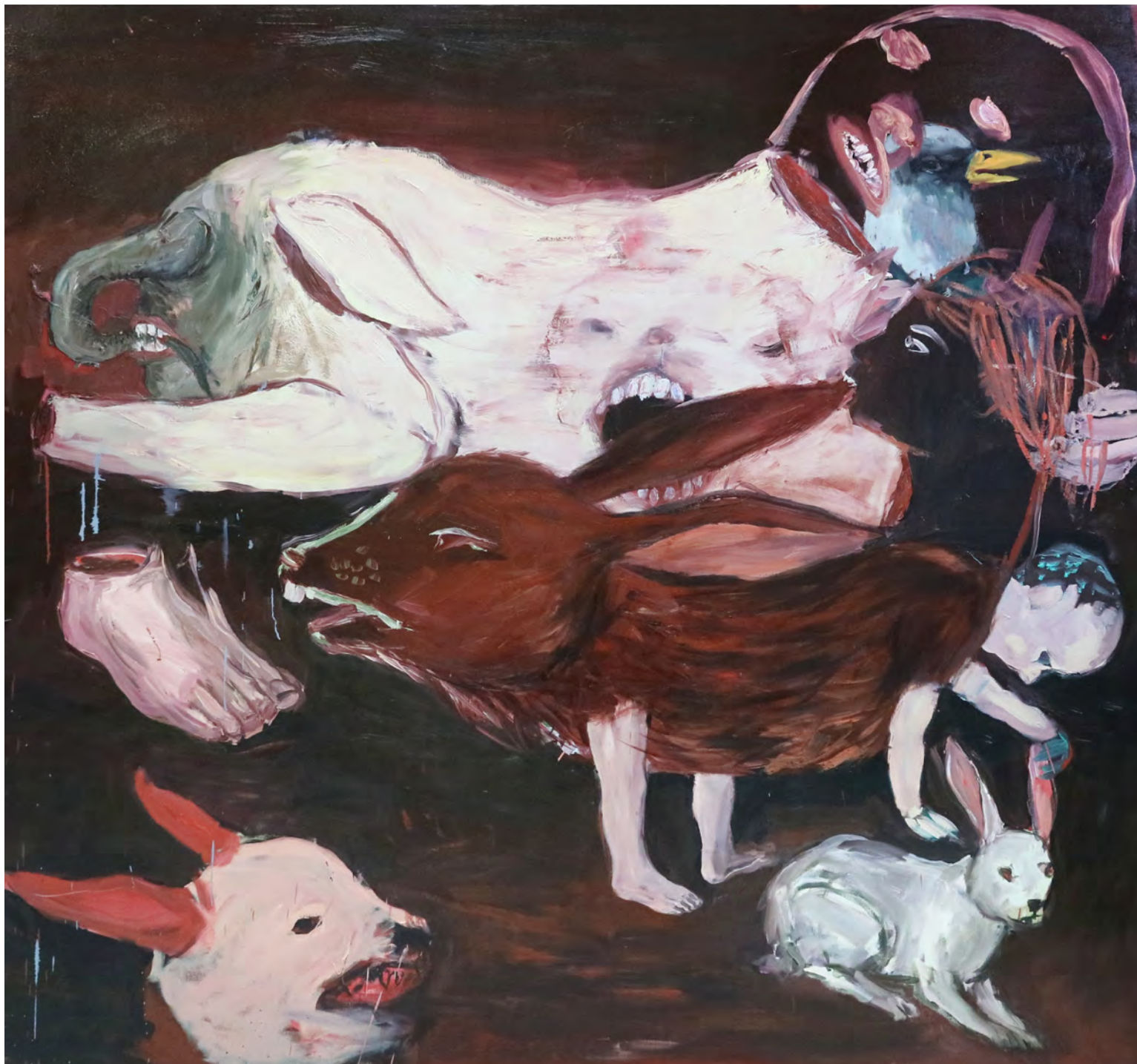
Mordida , 2017 óleo sobre tela [oil on canvas] Ed. única [unique] . 190 x 190 cm