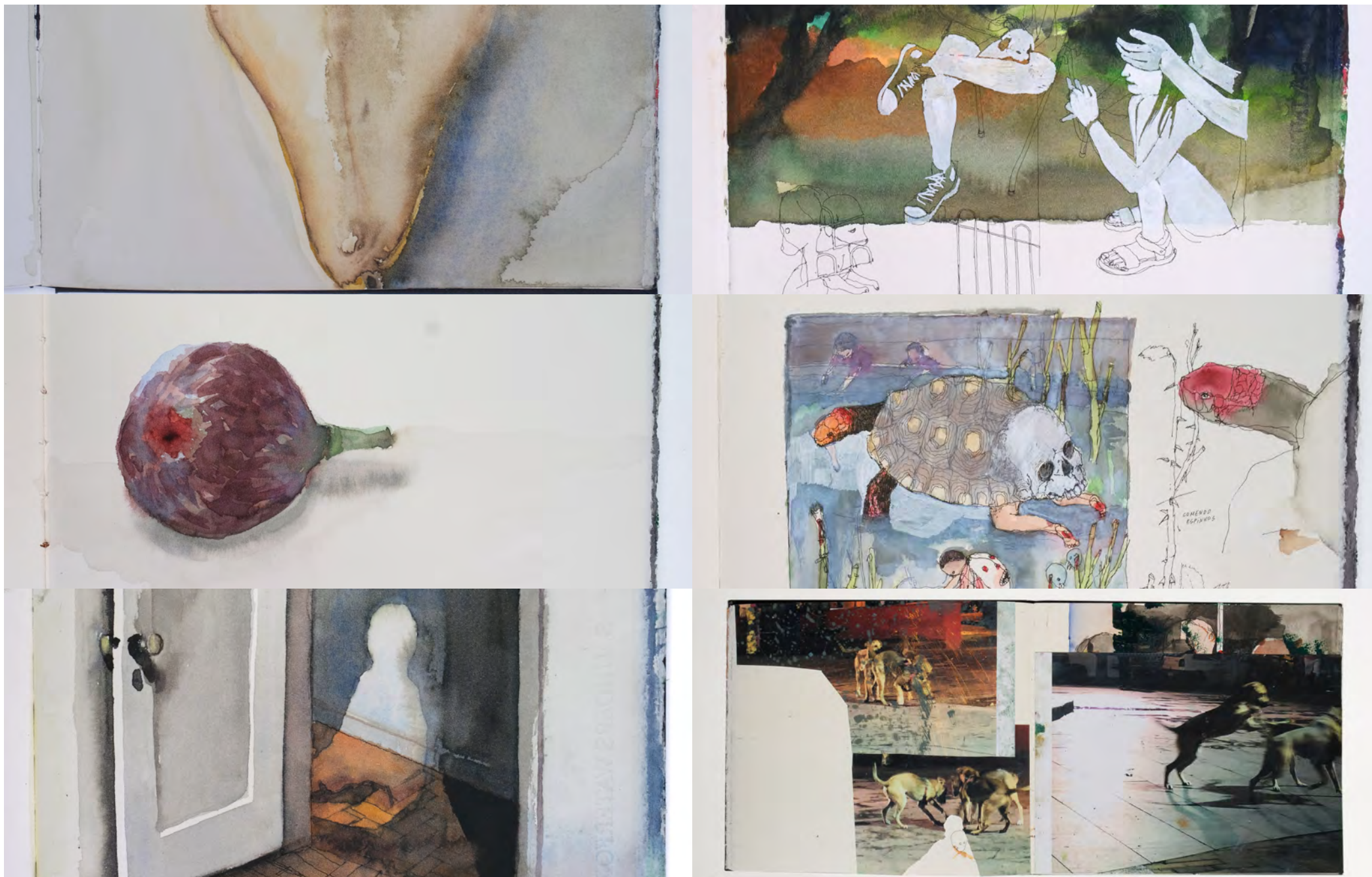
detalhes Sem Título [Untitled] , 2018-2019 . mesa com 10 cadernos, cavalete e tampo de vidro [table with 10 notebooks, easel and glass cover] . Ed. única [unique] . 187 x 147 cm