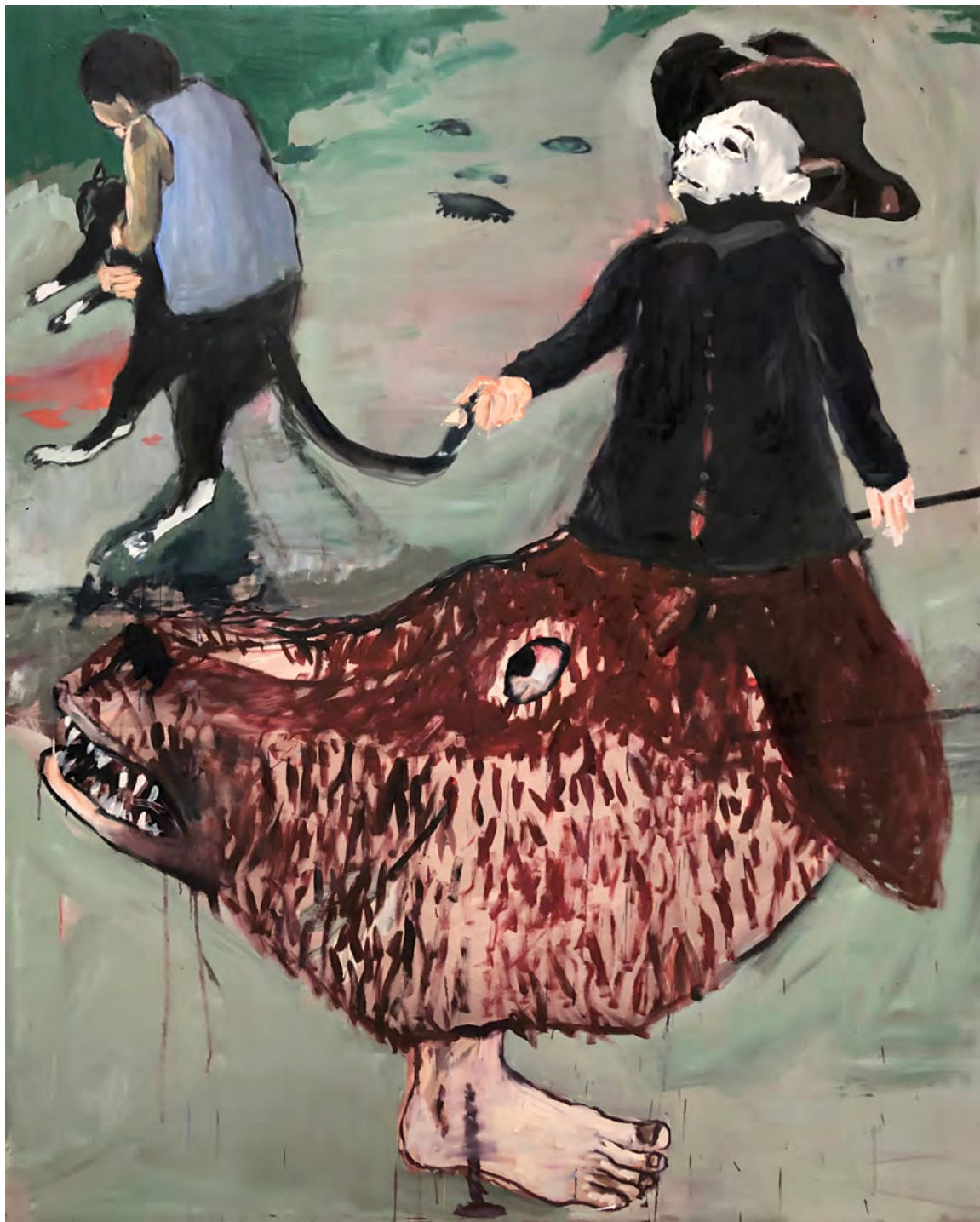
Gato , 2018 óleo sobre madeira [oil on wood] Ed. única [unique] . 220 x 160 cm