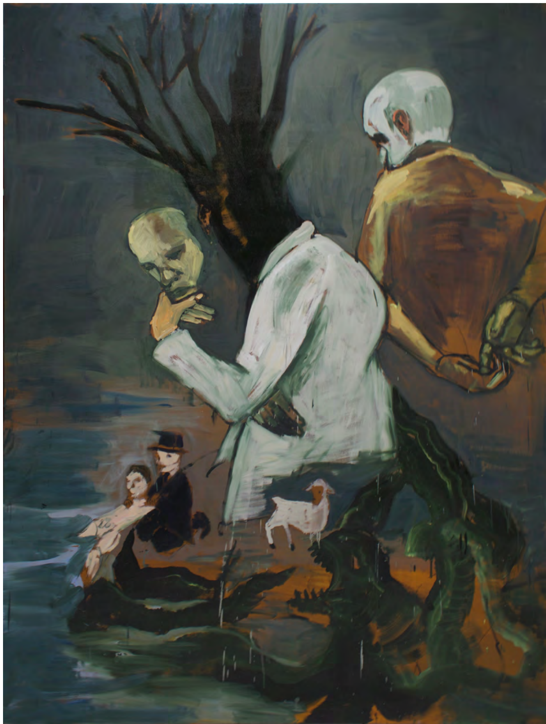
Árvore , 2016 óleo sobre tela [oil on canvas] Ed. única [unique] . 270 x 190 cm