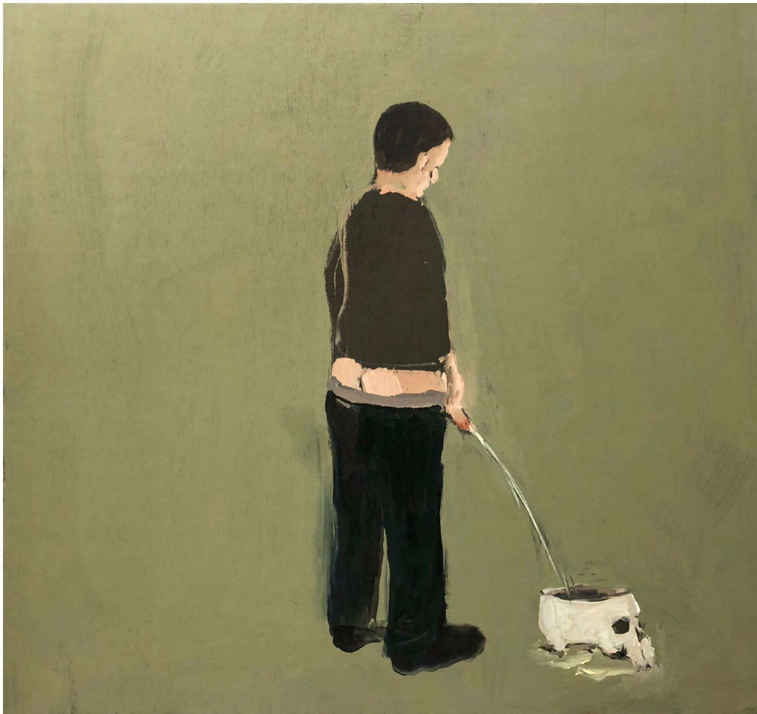
Recipiente , 2018 óleo sobre madeira [oil on wood] Ed. única [unique] . 80 x 80 cm