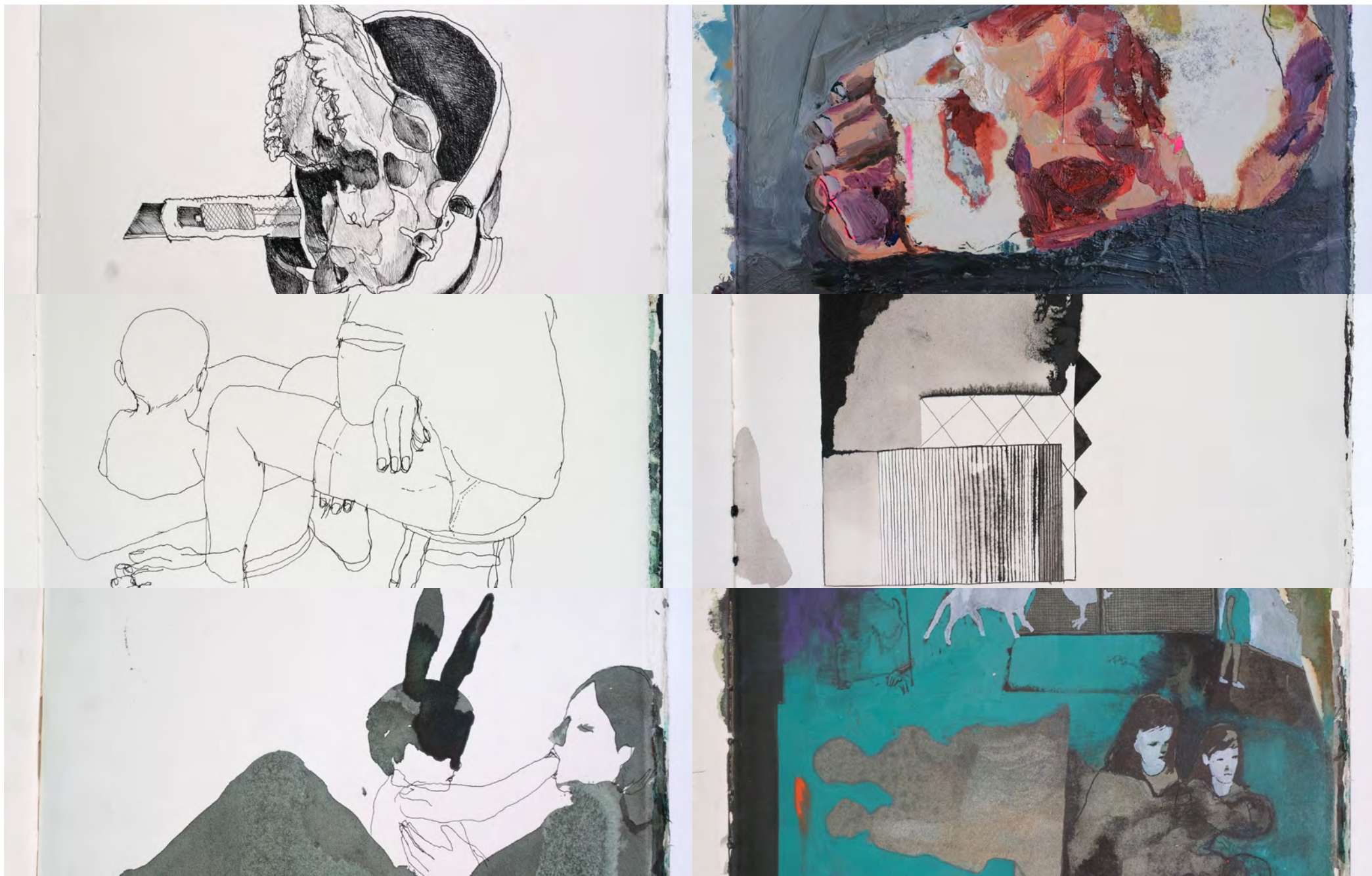
detalhes Sem Título [Untitled] , 2018-2019 . mesa com 10 cadernos, cavalete e tampo de vidro [table with 10 notebooks, easel and glass cover] . Ed. única [unique] . 187 x 147 cm