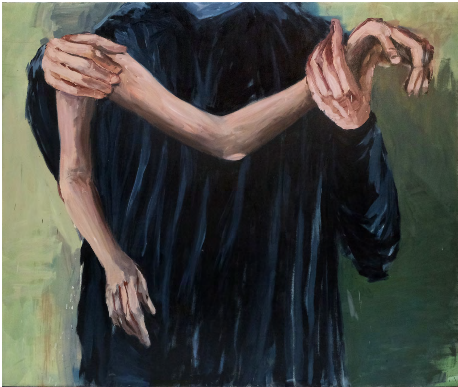
Ombro , 2018 . óleo sobre tela [oil on canvas] . Ed. única [unique] . 190 x 220 cm