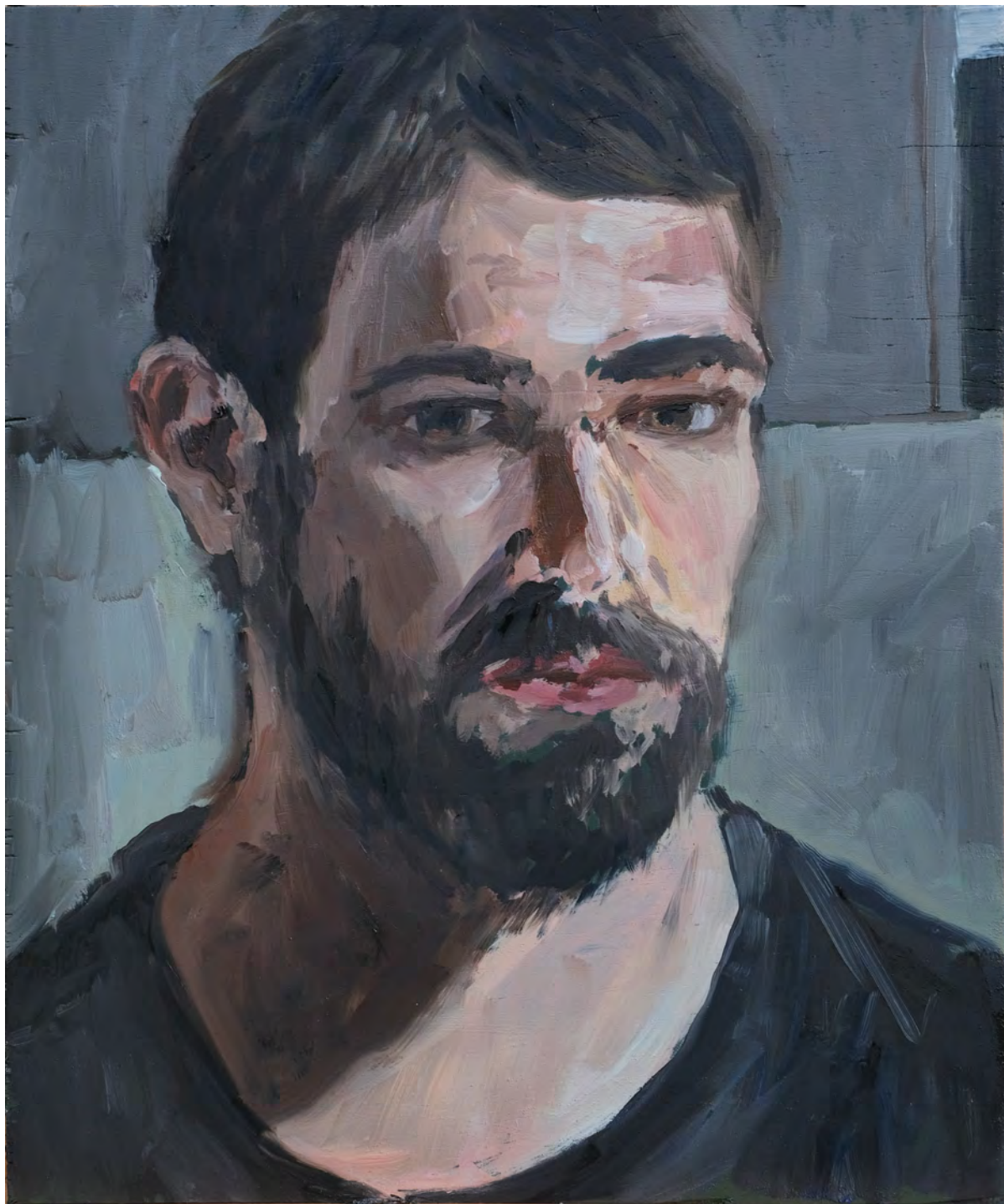
Autorretrato , 2019 óleo sobre tela [oil on canvas] Ed. única [unique] . 47 x 37 cm