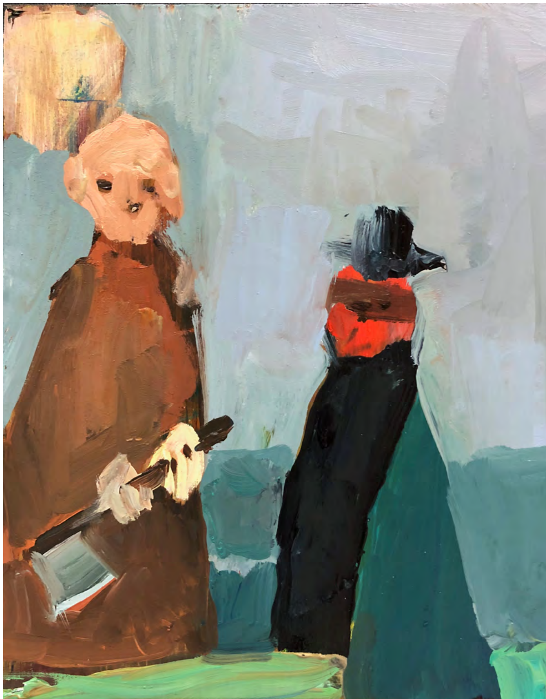
Pinheiro , 2019 óleo sobre madeira [oil on wood] Ed. única [unique] . 26 x 20,5 cm