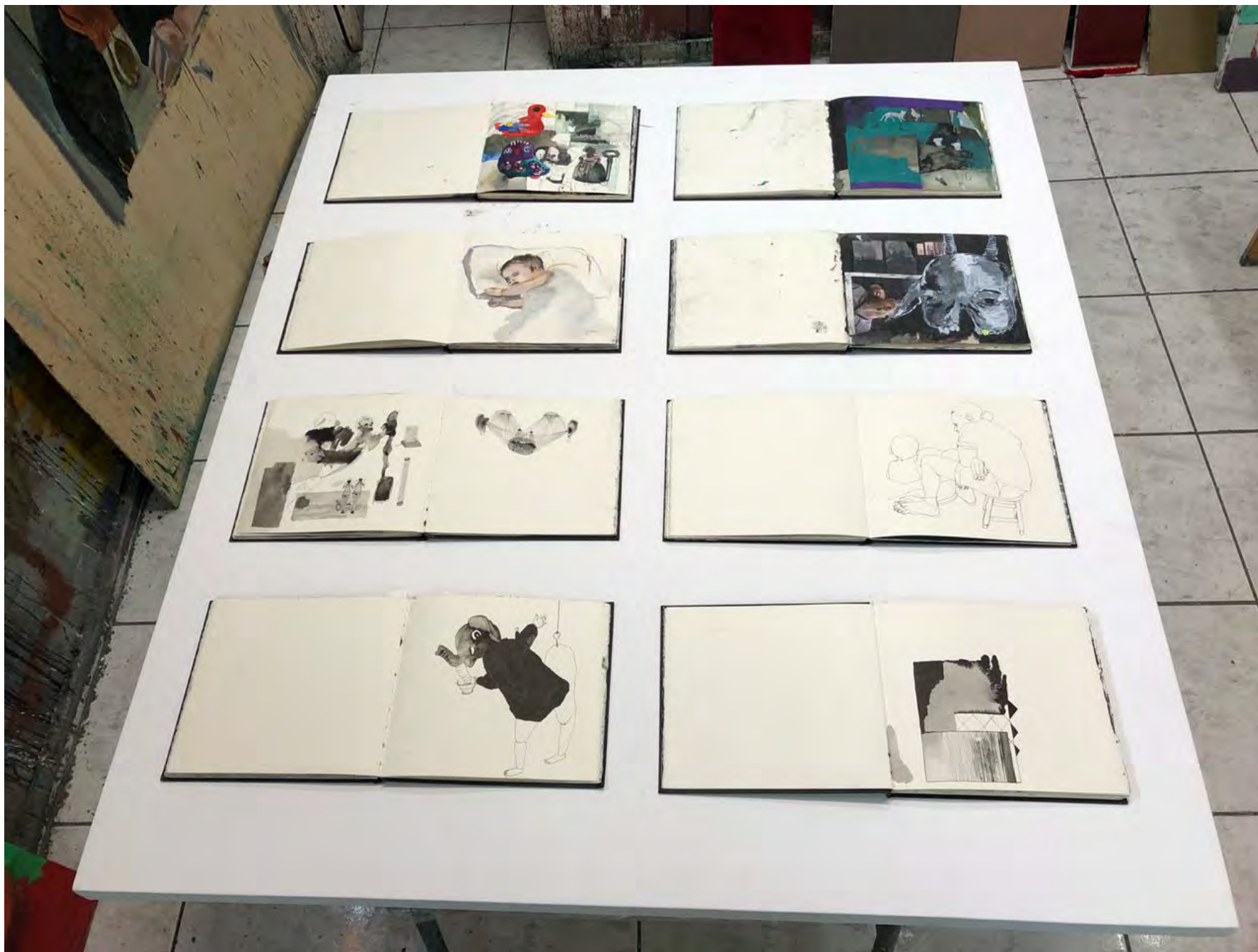
Sem Título [Untitled] , 2018-2019 . mesa com 10 cadernos, cavalete e tampo de vidro [table with 10 notebooks, easel and glass cover] . Ed. única [unique] . 187 x 147 cm